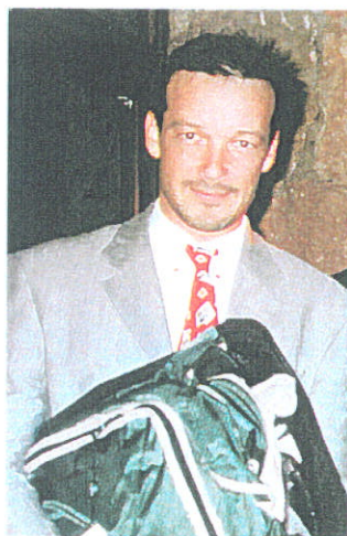
Schauspieler Michael Roll