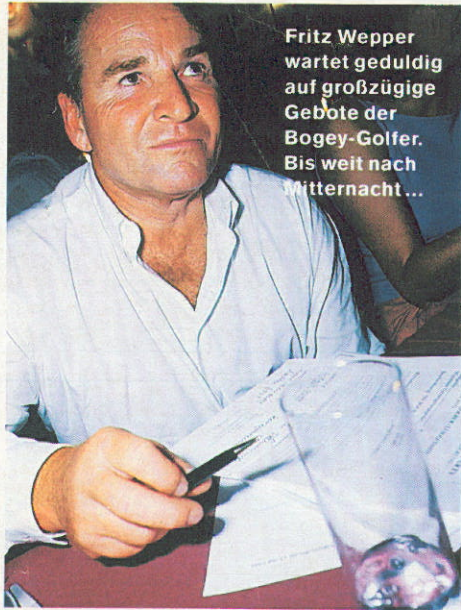
Fritz Wepper wartet geduldig auf großzügige Gebote der Bogey-Golfer. Bis weit nach Mitternacht...