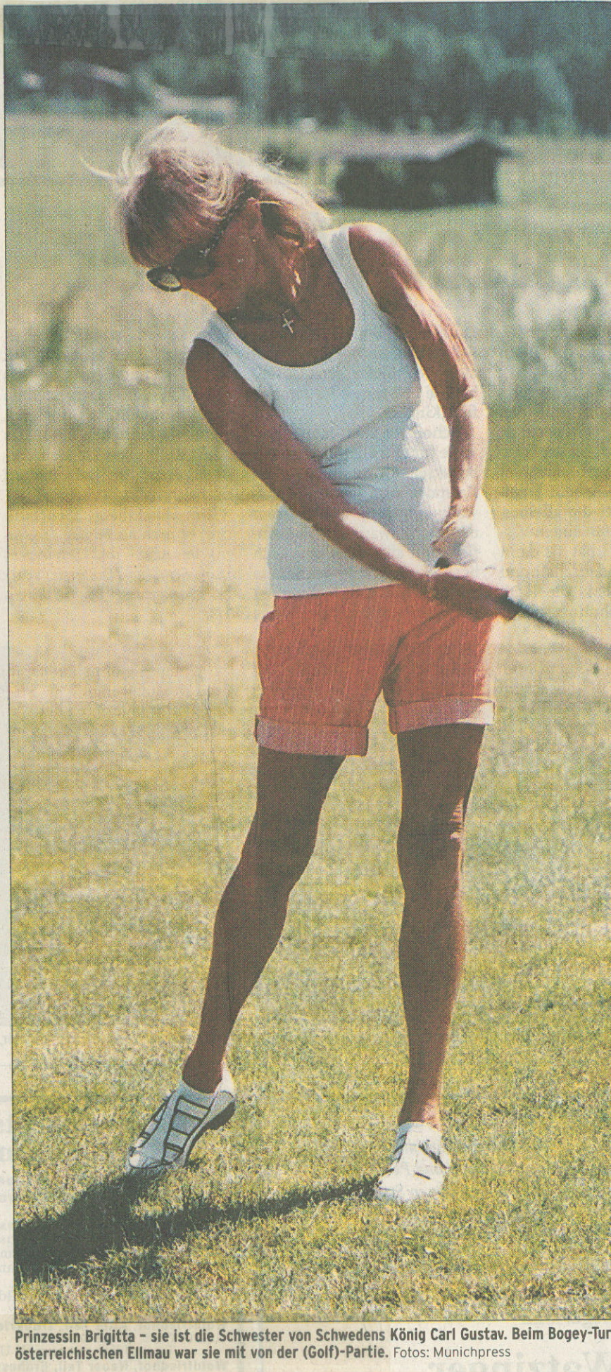
Prinzessin Brigitta - sie ist die Schwester von Schwedens König Carl Gustav. Beim Bogeys-Turnier im österreichischen Ellmau war sie mit von der (Golf)-Partie.