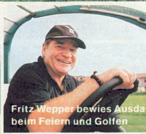
Fritz Wepper bewies Ausdauer beim Feiern und Golfen