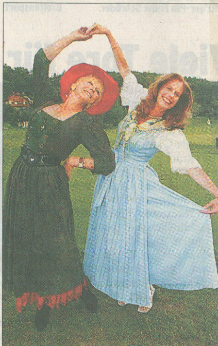
„Fräuleinwunder“ und „Lady Bump“: Elke Sommer und Penny McLean (r.) mal ungewohnt trachtig beim Volkstanz.