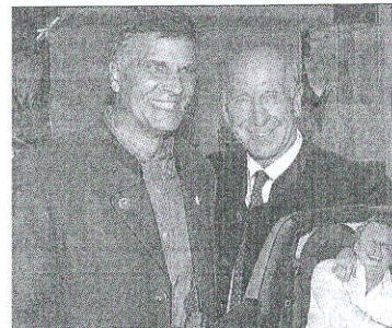
Foto oben: Zwei Sportlegenden gingen sich die Ehre - Marc Spitz und Sir Bobby Charlton