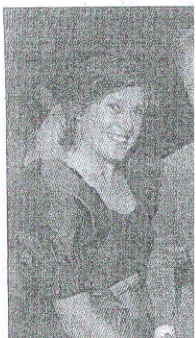
Kolumnistin und Talker Johannes B. Kerner Fotos